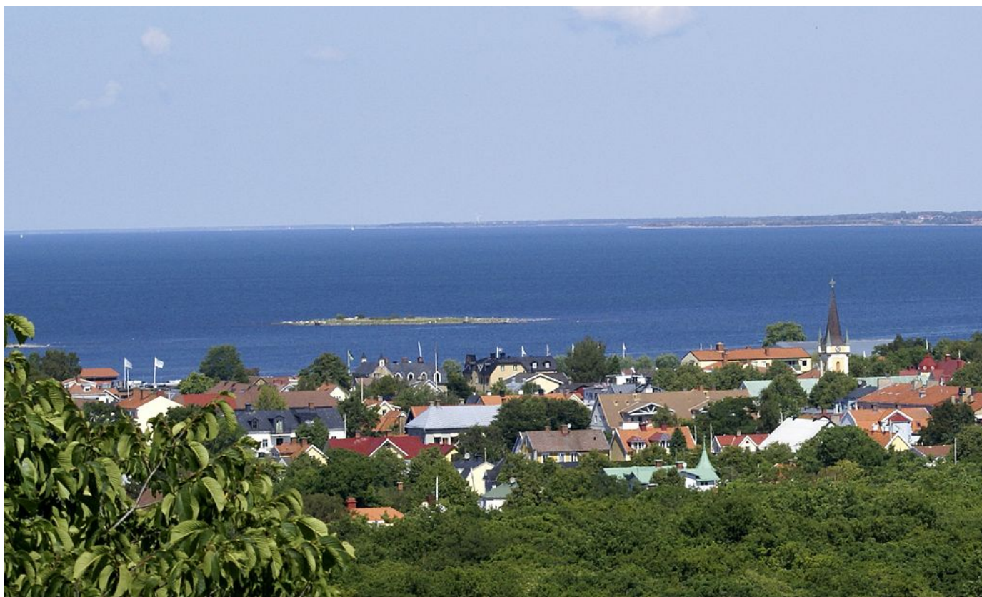
Borgholm sett från Borgholms slottsruin