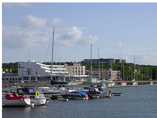
Strand hotel med Borgholms slottsruin