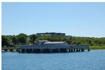
Borgholms kallbadhus med Borgholms slottsruin uppe på västra landborgen i bakgrunden