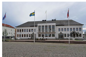
Stadshuset från 1942, ritat av Gösta Gersjö