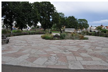
Societetsparken vid hamnen i Borgholm