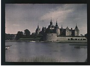
Kalmar slot i begyndelsen af 1900-tallet