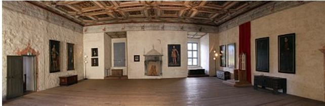
Den gyldne sal på slottet, med kassette loft 2009