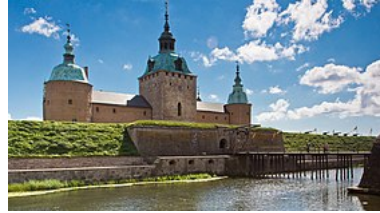
Kalmar slot, med vindebroen, set fra bysiden 2011