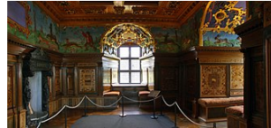
Kalmar slot, kongegemakket i tårnet 2009