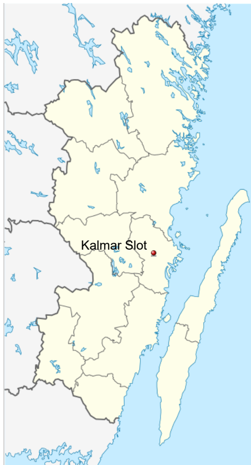
Kalmar Slots beliggenhed

56°39′29.16″N 16°21′19.08″E ﻿ ( https://tools.wmflabs.org/geohack/geohack.php?language=da&pagename=Kalmar_Slot&params=56_39_29.16_N_16_21_19.08_E_type:landmark_region:SV )