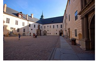
Slotsgården på Kalmar slot 2015