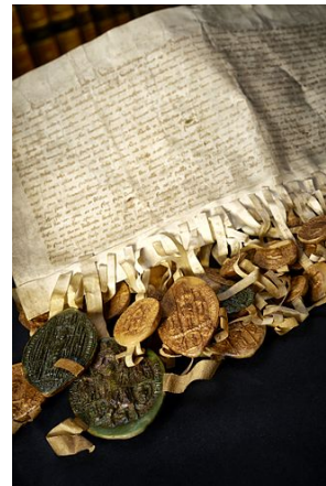
Erik af Pommerns kroningsbrev (Rigsarkivet. Foto: Tom Jersø)