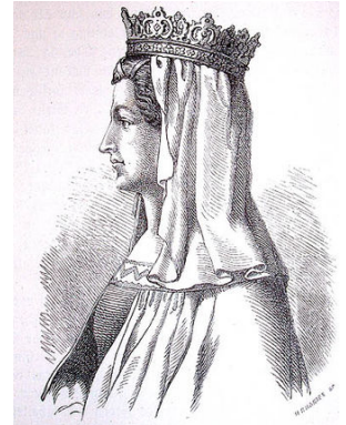
Margrethe er i eftertiden blevet symbolet på Kalmarunionen. Gravering af H.P. Hansen