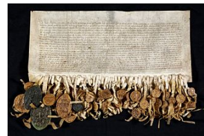
Kroningsbrevet, 13. juli 1397 (Rigsarkivet.)

Også Christian 1.s efterfølgere, kong Hans og Christian 2. forsøgte i flere omgange at genskabe unionen ved angreb mod den svenske rigsforstander Sten Sture , men efter det Det Stockholmske Blodbad i 1520 gjorde svenskerne oprør ( Den Svenske Befrielseskrig ), og 6. juni 1523 blev Gustav Vasa konge, hvilket egentlig betød en afslutning på Kalmarunionen. Men det var dog først i 1524, at enden på unionen blev vedtaget på skrift.