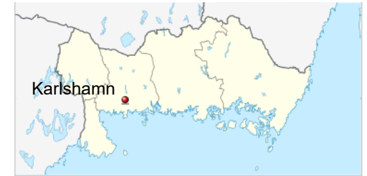
Karlshamns beliggenhed i Blekinge

56°10'N 14°51'E (https://tools.wmflabs.org/geohack/geohack.php?language=da&pagename=Karlshamn&params=56_10_N_14_51_E_type:city_region:SE)