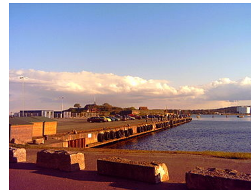
Havnen i Karlshamn